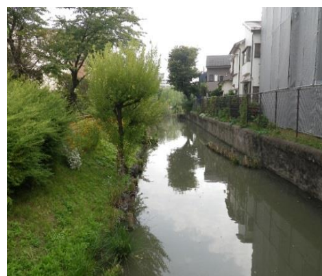
古隅田川自然再生区域