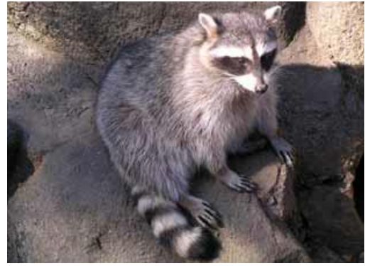
アライグマ（特定外来生物）

農林水産省「野生鳥獣被害防止対策マニュアルーアライグマ、ヌートリア、キョン、マンガース、タイワンリス（特定外来生物編）ー」（平成22年）