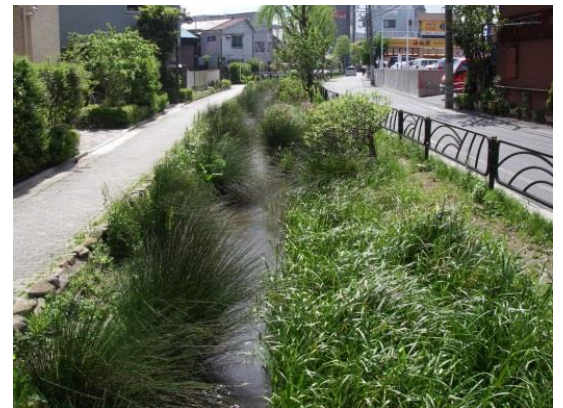
曳舟川自然再生区域