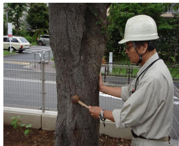
樹木点検の様子（木槌による打診）