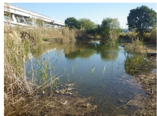
葛飾あらかわ水辺公園