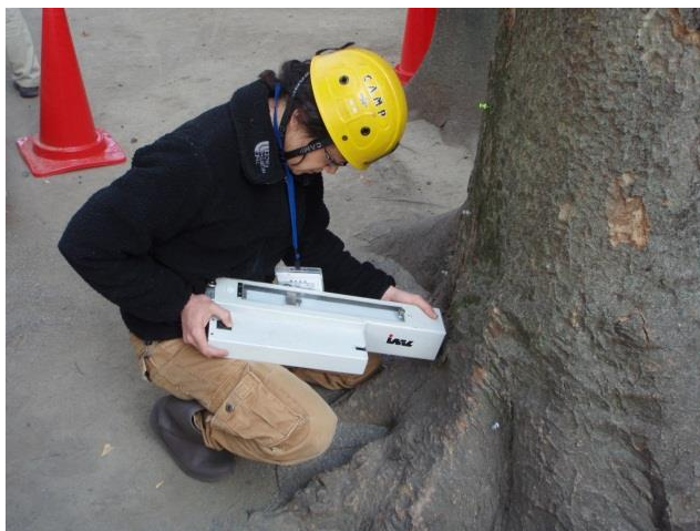
樹木点検の様子（幹内部の検査）