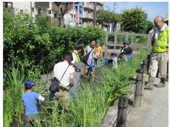
かつしか生きもの調査部活動の様子