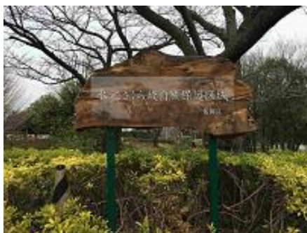
水元さくら堤自然保護区域