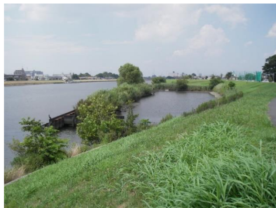
西水元水辺の公園