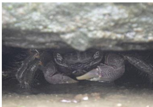
クロベンケイガニ

綾瀬川では、クロベンケイガニやテナガエビ、特定外来生物のカワヒバリガイなどが採取されました。