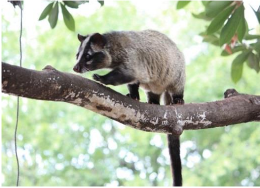
ハクビシン（外来生物）