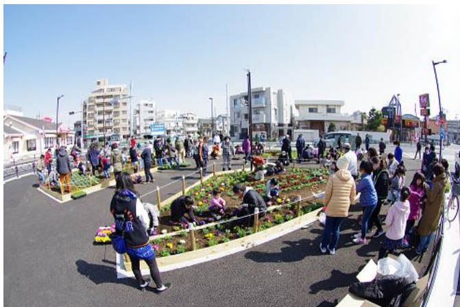
緑化活動団体による花壇管理の様子 柴又フロリズ花壇