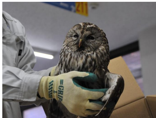
保護したフクロウ