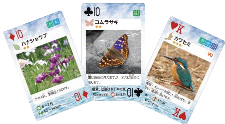
かつしか生きものトランプ

このトランプは、すでに区立小・中学校全学級などに配布していますが多くの区民にも、本区に生息している様々な生きものについての理解を深めていただくため、また生物多様性の保全の重要性を広めるため、区役所3階区政情報コーナーにて、1個300円にて有償販売しています。