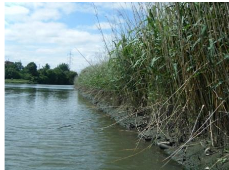
大場川中州自然保護区域