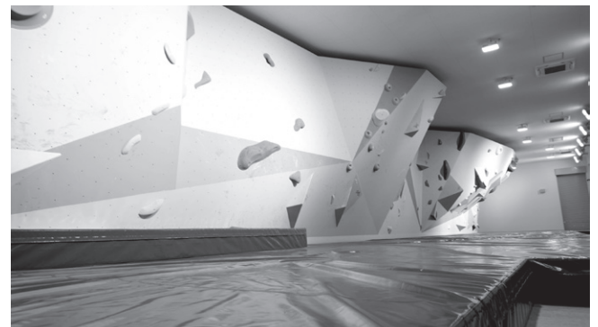
スポーツクライミングセンター（ボルダリングウォール）