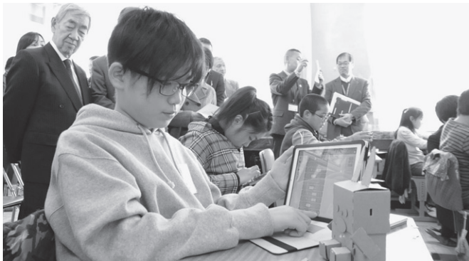
ICT機器を活用した授業