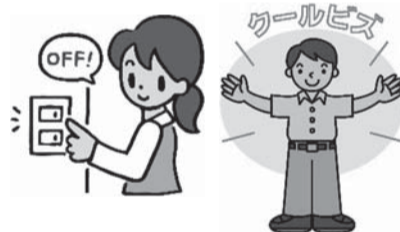
省エネ行動(昼休みなどの消灯・クールビズなど)