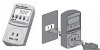
ワットチェッカー