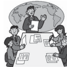
社員への環境教育の実施