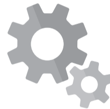
生産工程における不要な動力、熱の使用、照明の見直し