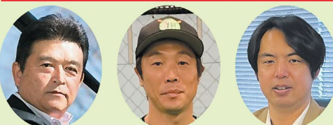
小早川 毅彦さん 元広島東洋カープ投手 鈴木 尚広さん 元読売ジャイアンツ野手 井川 慶さん 元阪神タイガース投手