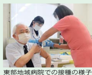
東部地域病院での接種の様子

区内の医療機関でも、医療従事者へのワクチン接種が始まりました。ワクチンの供給量が限られているため、新型コロナウイルス病床や、発熱外来で対応を行う医療従事者から優先的に接種を進めていきます。