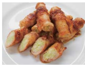
▲令和2年度最優秀作品「ブロッコリーの芯の豚肉まき」

FAX03 - 5698 - 1534 ☎060800@city.katsushika.lg.jp ☎03 - 5654 - 8273