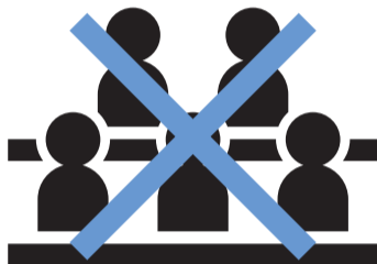
密を回避した行動

施設の利用制限やイベントの中止・延期などを行っています。詳しくは区ホームページをご覧ください。はなしょうぶコール(☎03-6758-2222)へお問い合わせください。なお、新型コロナウイルスの影響により施設利用予約をキャンセルする場合、利用料の返還を行います。詳しくは各施設へお問い合わせください。