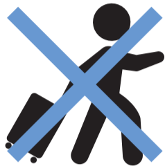
日中を含む不要不急の外出自粛