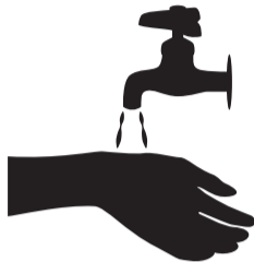
小まめな手洗い・消毒