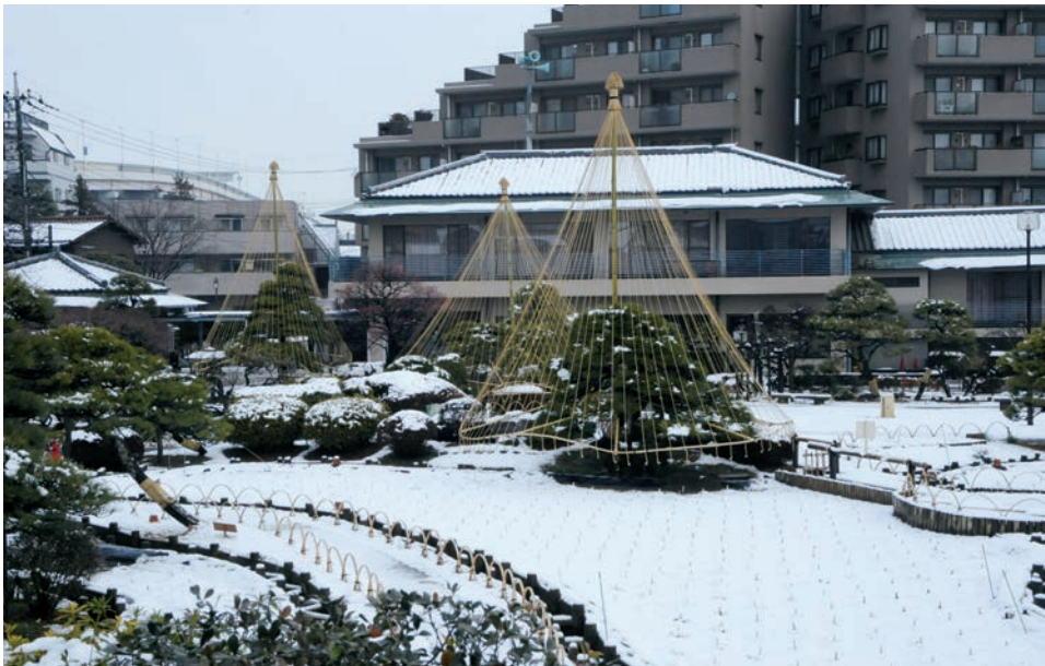
堀切菖蒲園の雪吊り