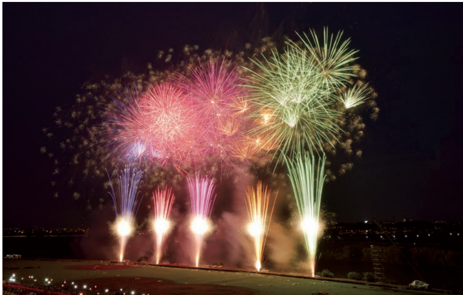
葛飾納涼花火大会