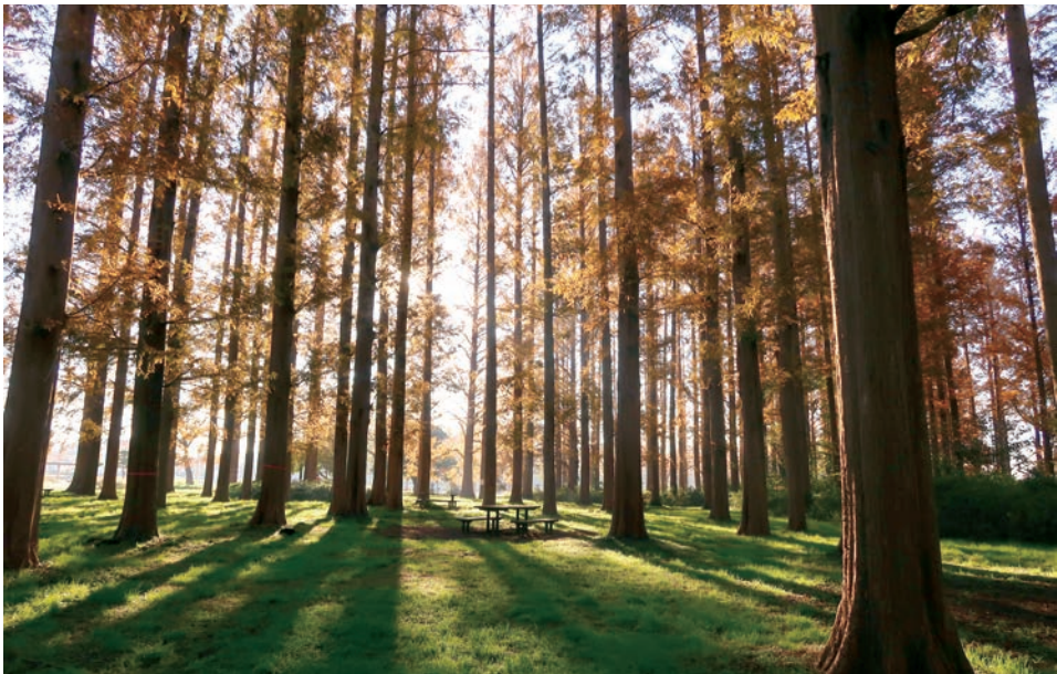
水元公園のメタセコイア