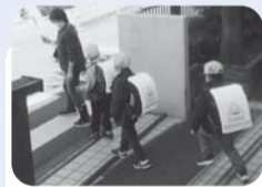
▲1年生下校サポート