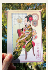
記念ポストカード