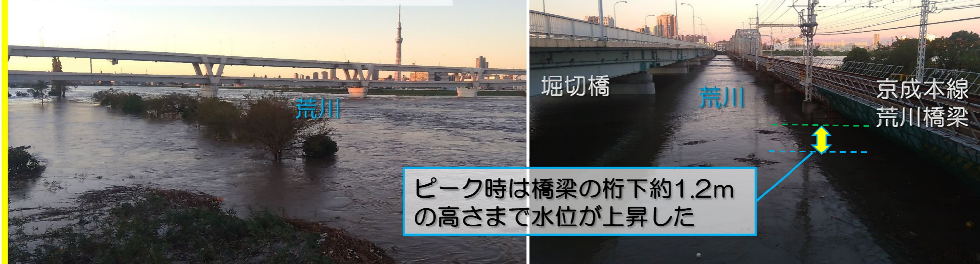
令和元年東日本台風時の荒川増水状況

荒川浸水想定区域図 (3日間総雨量632mm) ※想定最大規模(1000年以上に1度の規模の大雨) 破堤点：荒川左岸10.50km(京成本線橋梁部)