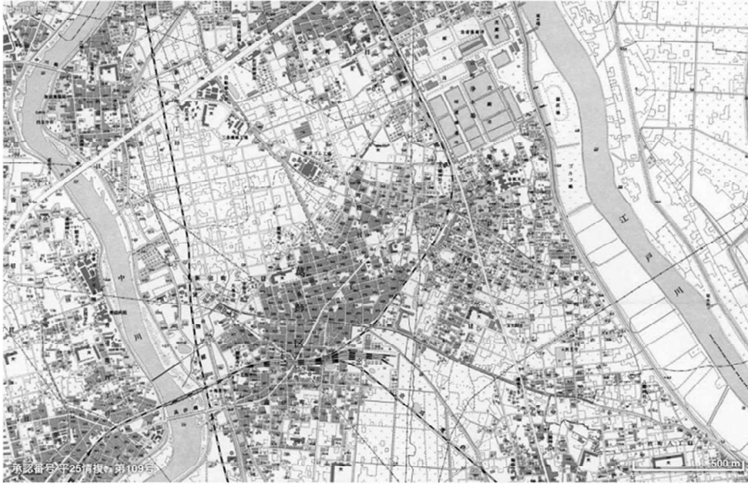
高度成長期前後（1万分1地形図「金町」1958年修正）