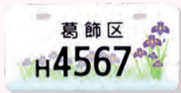
▲花しょうぶ(原付I種の場合)