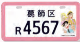
▲こち亀(原付II種甲の場合)