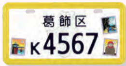
▲かるた(原付II種乙の場合)