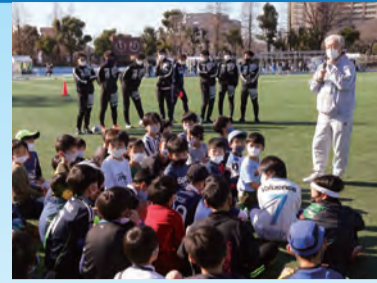
▲キャプテン翼 CUPの様子