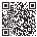
▲公式ホームページ

種目や参加費など詳しくは、かつしかふれあいRUNフェスタ公式ホームページをご覧ください。