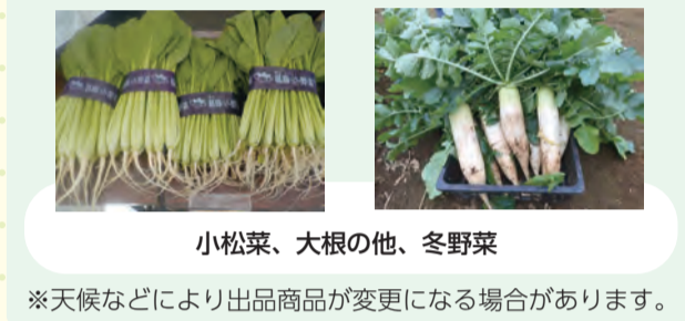
小松菜、大根の他、冬野菜