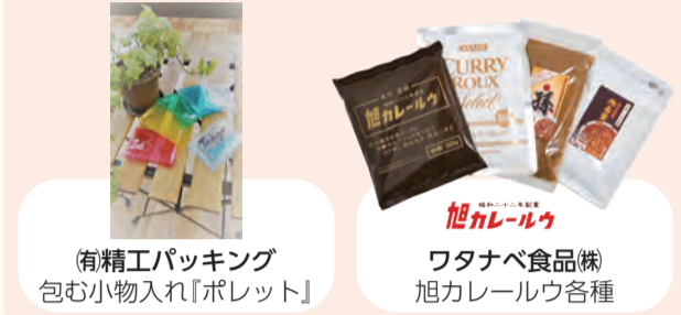
(有精工パッキング) 包む小物入れ「ポレット」