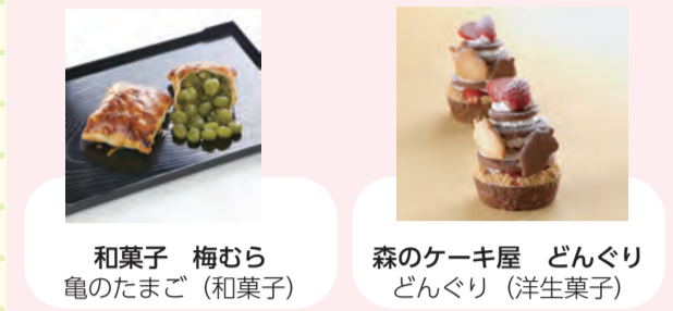
和菓子 梅むら 亀のたまご (和菓子)