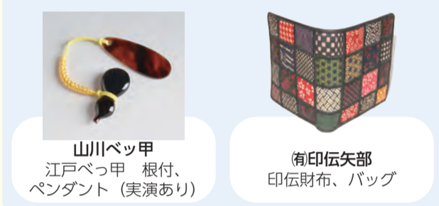
山川ベッ甲 江戸ベッ甲 根付、ペンダント (実演あり)