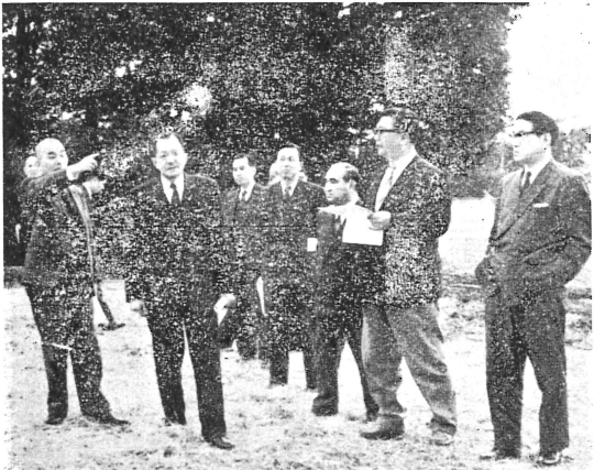
写真……小川区長(手を上げている人)の説明を聞く東都知事(その右) = 水元釣仙郷

区役所のPRの特殊性 区役所に対するPRは主権者たる区民に対する義務であり、また「全体に対して奉仕するもの」である。民主政治は「政策の決定における公明と公表」「公務執行者即全体の奉仕者」の原則に即ち、区民の理解と信頼を促すことである。この原則に基づき、区役所は「政策の決定における公明と公表」「公務執行者即全体の奉仕者」の原則に基づき、区民の理解と信頼を促すことである。この原則に基づき、区役所は「政策の決定における公明と公表」「公務執行者即全体の奉仕者」の原則に基づき、区民の理解と信頼を促すことである。