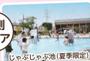
じゃぶじゃぶ池 (夏季限定)