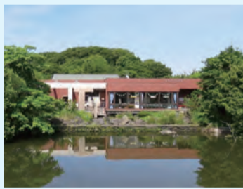
かわせみの里について詳しくはこちら▶

水元公園にある水元小合溜の水辺環境を回復させ、さまざまな生き物が生息していた環境に戻すことを目的とした水質浄化施設です。「水辺の宝石」とたたえられる野鳥「カワセミ」が観察できる他、室内にある「水辺のふれあいルーム」では、魚やカメ、植物などを観察できたり、専門員から自然環境に関するガイドを受けられたり、遊びながら学べる展示や講座などを行っています。