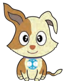
▲行政相談マスコットキクーン