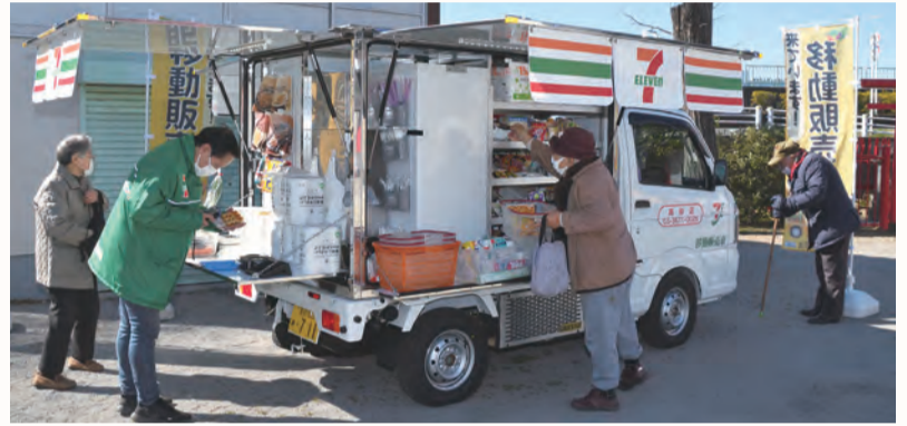
区では、区民の方々の日常生活の利便性向上、地域コミュニティの活性化のため、今後も町会を支援していきます。