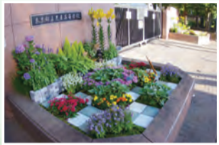
東京都立農産高等学校園芸デザイン科