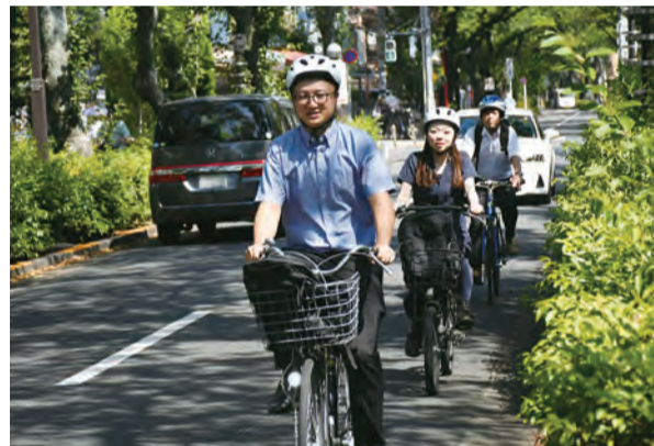
※撮影に使用した一部ヘルメットは、(株)カニック企画 (水元1-4-10) より提供。