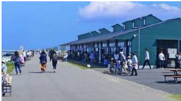
閑上地区かわまちづくり