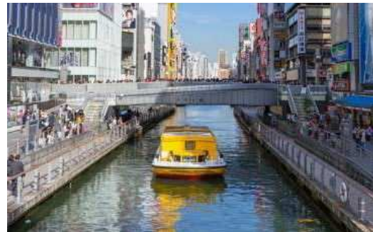
大阪市かわまちづくり