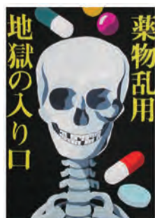
最優秀賞 みずの あかり 水野 あかり (水元中3年)