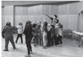
遊びのパートナー講座