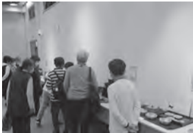
学んで見て触れて 陶器の魅力再発見