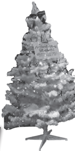
▲パープルリボンツリー