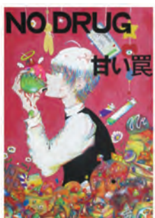
最優秀賞 まつもと ちえ 松本 知愛 (青葉中3年)