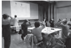
ツボで健康に! やさしい東洋医学講座