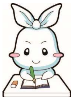
葛飾区ごみ減量・3R推進キャラクター リー（Ree）ちゃん