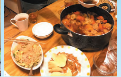
▲たまたま食堂の料理