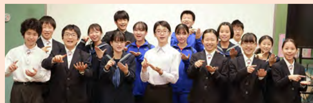
▲金町中学校アナウンス部の皆さん

金町中学校アナウンス部の皆さんに協力していただき、PR動画を作成しました。ぜひご覧ください。