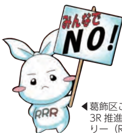
▲葛飾区ごみ減量・3R推進キャラクター(Ree)ちゃん

「全5回」とある講座は、全ての日程に参加してください。費用の記載がない事業は無料です。多数抽選の記載がある事業は、定員を超えた場合抽選します。詳しくは区HPをご覧ください。お問い合わせください。