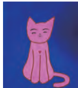
▲作品名「ほっとねこ」

会場 寅さん記念館(柴又6-22-19) ☎03-3657-3455 担 観光課