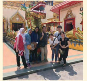
▲令和元年度の様子

区役所2階区民ホール、かつしかシンフォニーヒルズ、区民事務所、地区センター、図書館、学び交流館