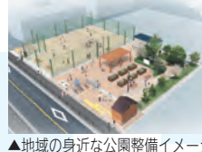
▲地域の身近な公園整備イメージ

飲食などを楽しめる拠点整備、プレイベントの実施などにより身近な河川・水辺空間をめざす「中川かわまちづくり」を推進します。中川右岸緑道公園親水テラスの照明設備設置工事を引き続き実施します。