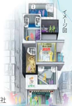
◎ 秋本治・アトリエビーだま/集英社

【担当課】 財政課 ☎03-5654-8119 政策企画課 ☎03-5654-8107