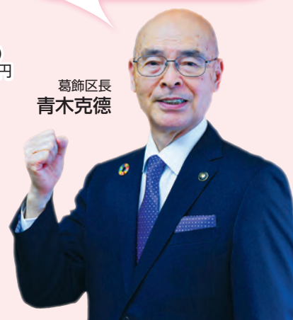
葛飾区長 青木克徳

多くの人から住んでみたい、住み続けたいと思われる魅力的なまちとして発展していくために、区民ニーズの高い政策をはじめ、区政を取り巻く環境の変化や地域課題に対応した政策を着実に進めていきます。