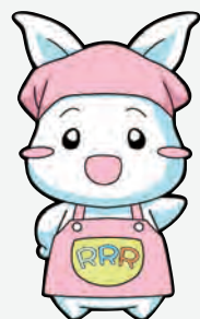
▲葛飾区ごみ減量・3R推進キャラクター(Ree)ちゃん