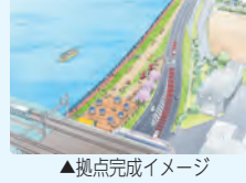
▲拠点完成イメージ