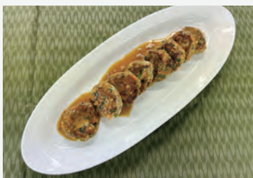
▲令和5年度最優秀賞「味噌バター サバゲ」